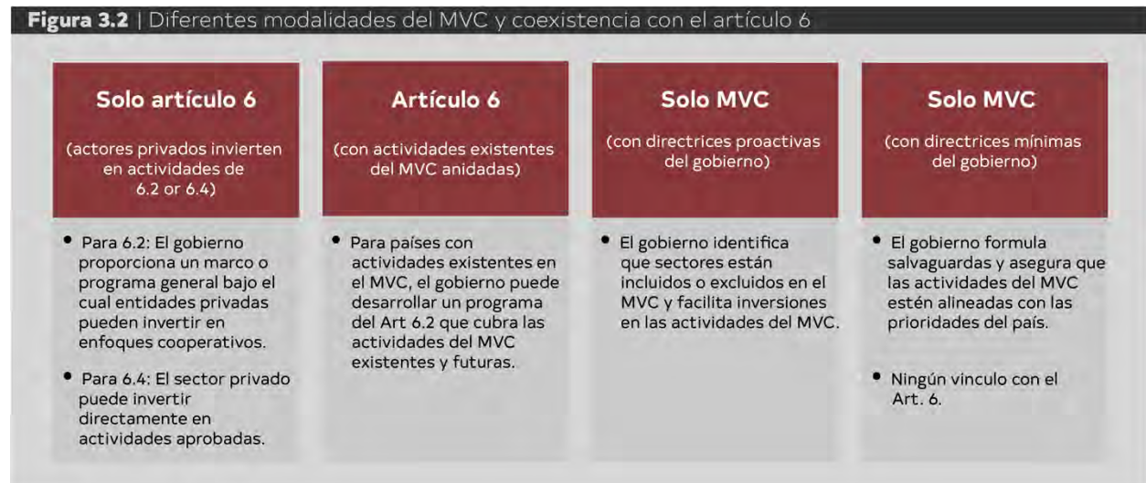
Figura 3.2 | Diferentes modalidades del MVC y coexistencia con el artículo 6

Los países anfitriones tienen control sobre si las reducciones de emisiones de GEI y captura de GEI atmosférico que se logran mediante las actividades del MVC se autorizarán como ITMO o se